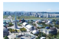
▲エクスボ科学公園

2010年10月に提携。国内随一の先端科学技術都市として注目されています。百濟時代に発見された儒城（ユソン）温泉が有名です。