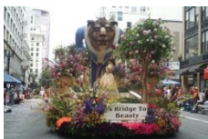
▲ローズフェスティバル

1959年11月に提携。オレゴン州最大の都市で、環境に優しい都市として知られています。毎年6月に開かれる「ローズフェスティバル」が有名です。