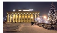
▲国立オペラ・バレエ劇場

1990年6月に提携。ロシア第3の都市で、世界で最も人口が急成長した街と言われています。音楽やバレエなど優れた芸術文化を誇ります。