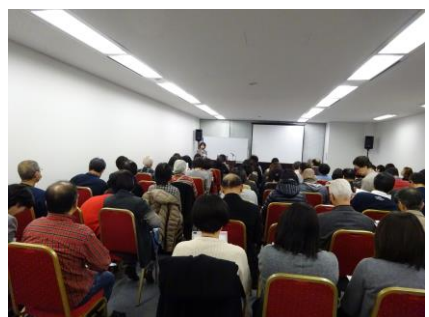
会場の様子(セミナー前半)