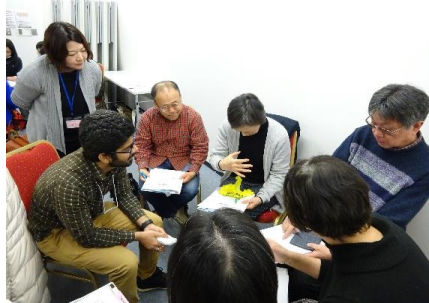
グループワークの様子(セミナー後半)

(公財)札幌国際プラザ 多文化交流部 〒060-0001 札幌市中央区北1条西3丁目 札幌MNビル3階 TEL 011-211-2105 FAX 011-232-3833 多文化交流部ホームページ http://plaza-sapporo.or.jp/citizen_j/