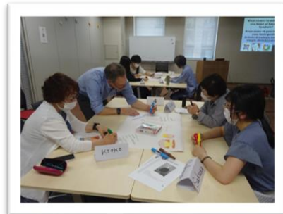
グループワークの様子

(公財)札幌国際プラザ 多文化交流部 〒060-0001 札幌市中央区北1条西3丁目 札幌MNBビル3階 TEL 011-211-2105 FAX 011-232-3833 多文化交流部ホームページ https://plaza-sapporo.or.jp/citizen_j/