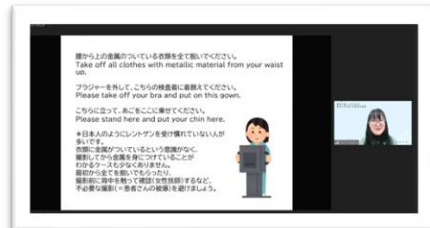
オンライン講義の様子